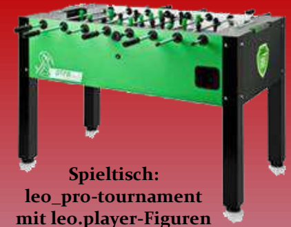
Spieltisch: leo_pro-tournament mit leo.player-Figuren (offizieller ITSF- und DTFB-Tisch)